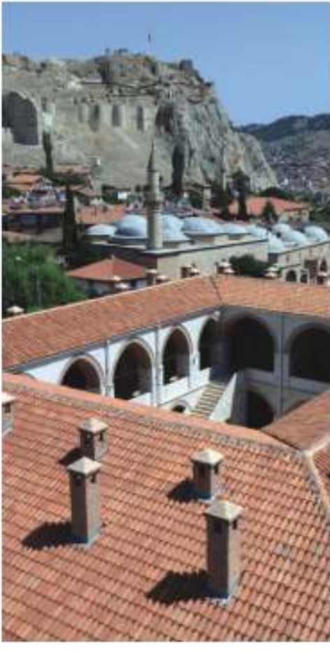
Sulusokak, Devletler Hanı, Tavukçiler Camii, Anıtsal Beşiktaş, Sulu Han, Tokat Kalesi (Sulusokak Street, Devletler Hanı, Tavukçiler Camii, Anıtsal Beşiktaş, Sulu Han, Tokat Kalesi)

BİR ŞEHİR, BİRCOK MEDENİYET one state many civilizations